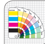
Silkprint Siebdruck Sérigraphie