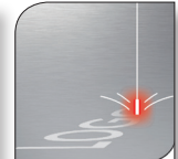
Engraving Lasergravur Gravure laser