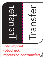
Foto imprint Fotodruck Impression par transfert

Logo size / Logo Grösse / taille du logo: