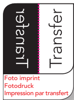
Foto imprint Fotodruck Impression par transfert

Logo size / Logo Grösse / taille du logo: