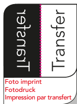
Foto imprint Fotodruck Impression par transfert